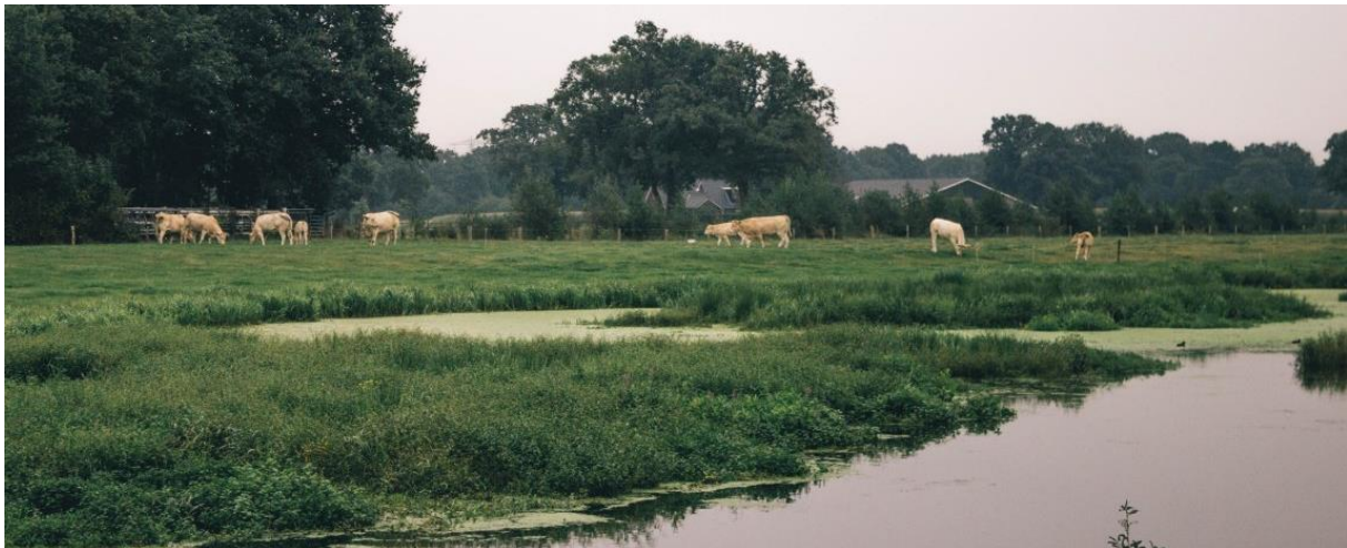
Direct grenzend aan het Twentekanaal ontdekken bezoekers een uitgestreker landschap met maten en flieren.

Beoogd resultaat is om stapsgewijs dit meerjarenplan samen met partners te realiseren. Aan de hand van een meerjarenplan wil de WGL-Almelo de komende jaren met een integrale aanpak de maatschappelijke ontwikkelingen inzetten als kans om de meerwaarde van dit gebied verder te vergroten voor Almelo en omstreken. Daarnaast pakken we ook kleinere verbeterprojecten op die zich voordoen met subsidies, steunfondsen en andere clubacties. Onder het motto 'Westelijke Groene Long Beleefbaar en Groen? Dat gaan we samen doen!', zet de WGL-Almelo zich in voor behoud van een uniek groen landschap nabij de stad, meer biodiversiteit, herstel en versterken kwetsbare dier- en plantsoorten, een bijdrage aan klimaatadaptatie en een beleefbare schone Westelijke Groene Long Almelo.